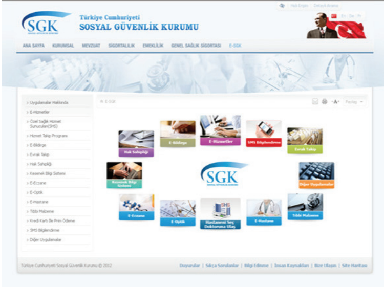
E-Sgk Sayfası Görünümü