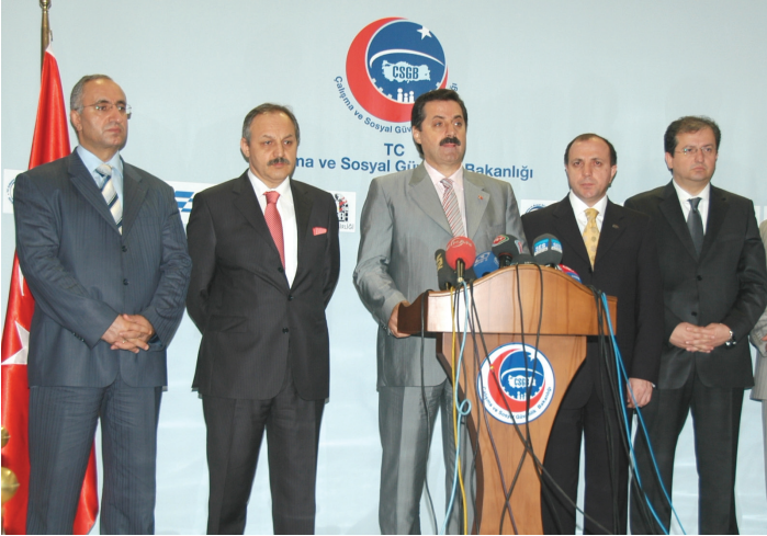
Bakanımız Sn. Faruk ÇELİK' in Prim Borçlarının Yapılandırılması ile ilgili Basın Açıklaması/ Temmuz 2008- Ankara

6111 sayılı Kanun kapsamında Kurum alacaklarının yapılandırılmasına dair 2 milyon 293 bin 579 kişi başvuru yaparak, 28 milyar 245 milyon 535 bin 494 TL tutarında Kurum alacağı yapılandırılmış ve 1 Nisan 2013 itibariyle 11 milyar 275 milyon 830 TL si tahsil edilmiştir.