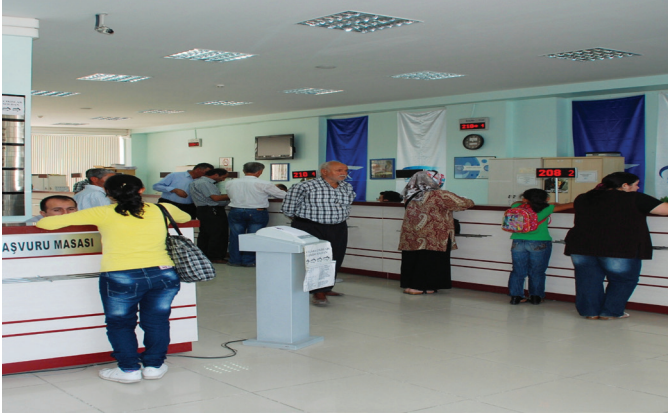
Hizmet Binalarımızın İç Konsepti