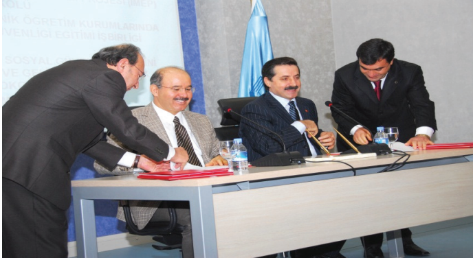
Bakanımız Sn. Faruk Çelik ile Milli Eğitim Bakanı Sn. Hüseyin Çelik'in Katıldığı Öğrencilerde Sosyal Güvenlik Bilinci Oluşturmaya ve Geliştirmeye Yönelik İş Birliği Protokolü İmza Töreni / Ocak 2008 - Ankara

Öğrencilerde sosyal güvenlik bilinci oluşturmaya ve geliştirmeye yönelik iş birliği protokolünü, Çalışma ve Sosyal Güvenlik Bakanı Faruk Çelik ile Milli Eğitim Bakanı Doç. Dr. Hüseyin Çelik, 6 Ocak 2009 günü Milli Eğitim Bakanlığında gerçekleştirilen törende imzalamışlardır.