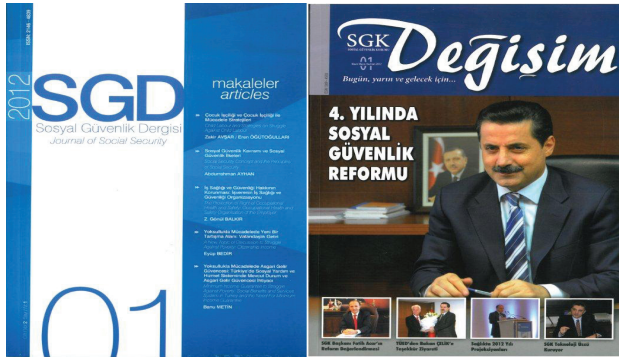
Sosyal Güvenlik Dergisi

Ayrıca, Kurumun faaliyet alanına katkısı olabilecek her alanda çalışmalara yer vererek, ülkemizin düşünsel birikimine katkıda bulunmak, toplumda sosyal güvenlik bilincini geliştirmek ve geleceğe dönük hedef ve beklentileri ortak bir noktada buluşturmak amacıyla da üç ayda bir hakemli Sosyal Güvenlik Dergisi yayımlanmaktadır. E-dergi Sosyal Güvenlik Eksenini ise, her üç ayda bir okuyucularla buluşmaktadır.