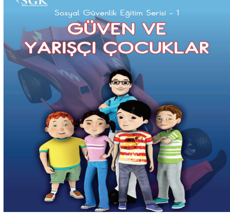
Güven ve Yarışçı Çocuklar