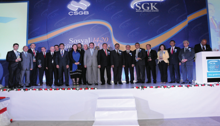
Sosyal Güvenlik Haftası En Yüksek Prim Ödeyen İşverenler Plaket Töreni/Mays 2012

Türkiye genelinde Sosyal Güvenlik Haftası etkinlikleri çerçevesinde merkez ve 81 il müdürlüğünde, 2009 - 2012 yılları arasında her yıl en yüksek prim ödeyen ilk 10 işverenimiz plaket ile ödüllendirilmektedir.