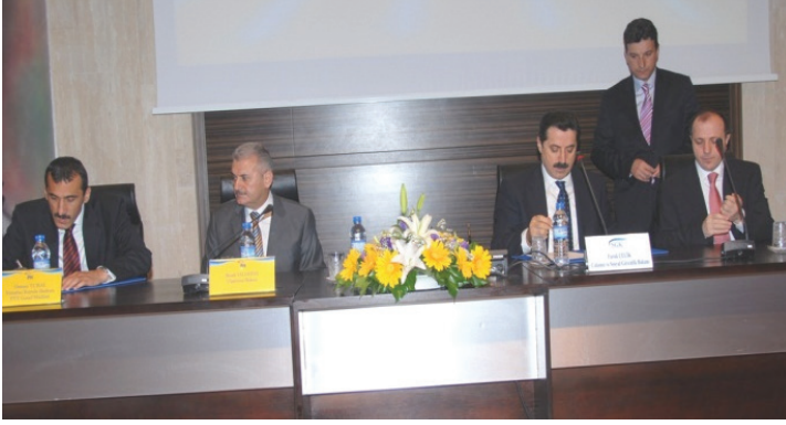
PTT ile Yapılan Protokolün İmza Töreni / Mayıs 2008