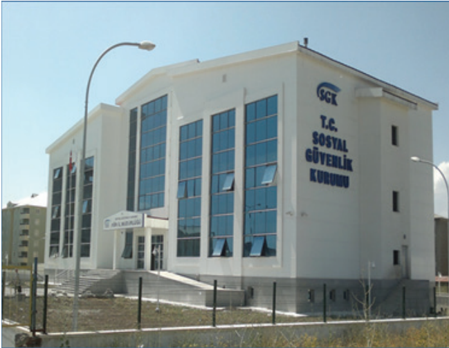
Ağrı İl Müdürlüğü

Hizmet binalarının ve fiziki mekanların iyileştirilmesi çalışmaları kapsamında 14 il müdürlüğü onarım, 16 il müdürlüğü yeni inşaat olmak üzere toplam 30 il müdürlüğü binası vatandaş odaklı yeni konseptte uygun olarak hizmete açılmıştır.