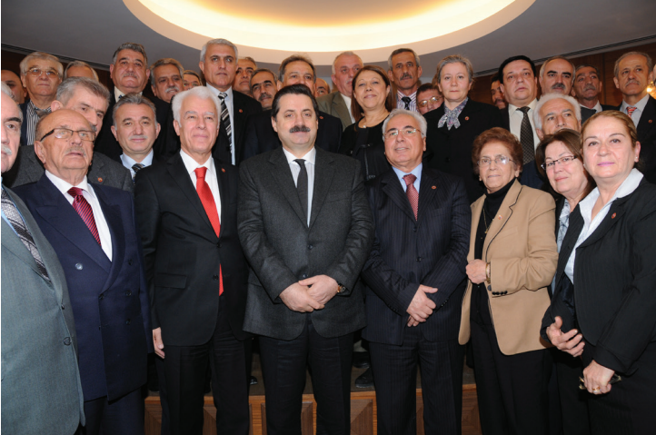
Sayın Bakanımız Türk Emeklileri Cemiyeti Üyeleri ile

Hesaplanan aylıklar mevcut aylıklarla mukayese edilerek yüksek olan aylıklar 2013/Ocak ödeme dönemi artışları da uygulanmak suretiyle ödenmiştir.