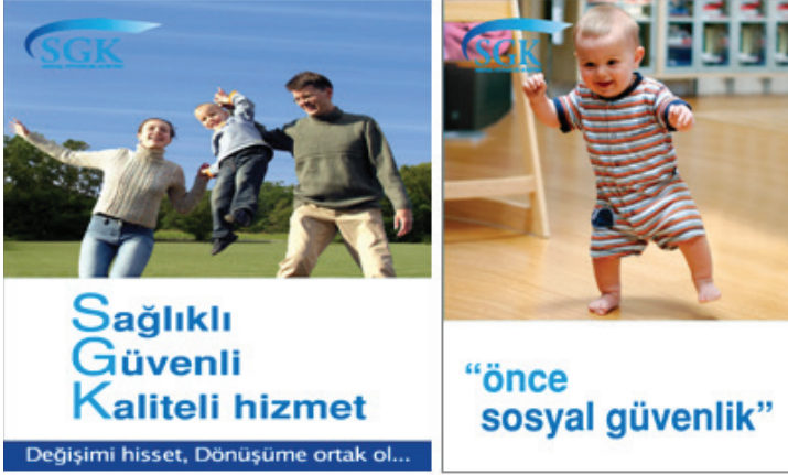
Kurumsal Kimlik ile İlgili Afişler