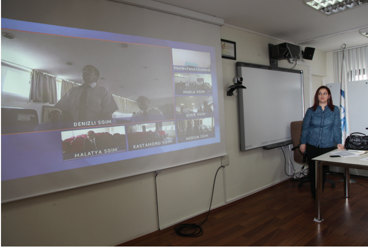
İnteraktif Eğitim ve Video Konferans Projesi/2012