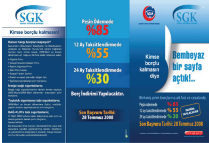
6111 sayılı Kanun ile İlgili Bilgilendirici Broşür

başvurdukları halde, ödeme yükümlülüklerini yerine getirmemeleri sebebiyle yapılandırma hakları 15/6/2012 ve öncesinde sona ermiş olan vatandaşlarımıza, 6322 sayılı Amme Alacaklarının Tahsil Usulü Hakkında Kanun İle Bazı Kanunlarda Değişiklik Yapılmasına Dair Kanun ile borçlarını ihya imkanı getirilmiştir.