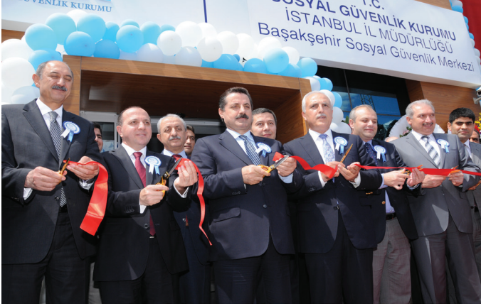
Bakanımız Sn. Faruk ÇELİK'in Katıldığı Sosyal Güvenlik Merkezi Açılışı Haziran 2012 -İstanbul/Başakşehir

Hizmetin vatandaşın ayağına götürülmesi amacıyla toplam 565 adet Sosyal Güvenlik Merkezinin kurulması kararlaştırılmış ve bunlardan 442 adedi faaliyetine başlamıştır.