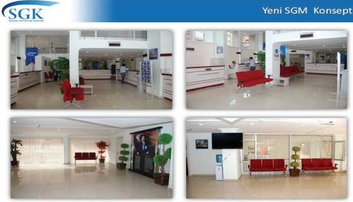
HHizmet Binalarımızın İç Konsepti